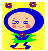
マスコットキャラクター ダイヤちゃん